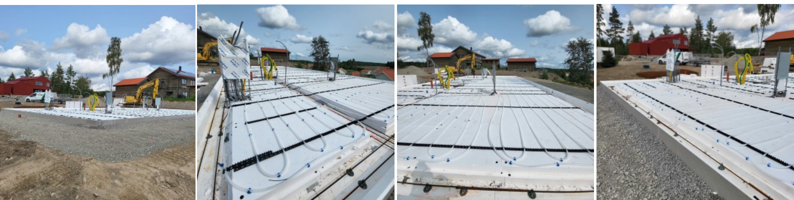
Budowa płyty fundamentowej energoszczędnej