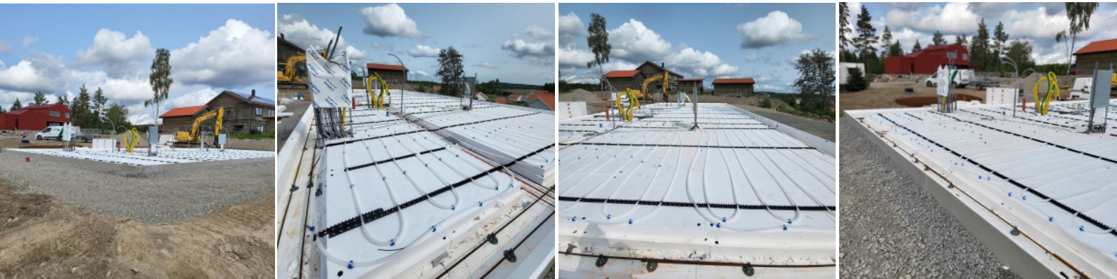
Budowa płyty fundamentowej energoszczędnej